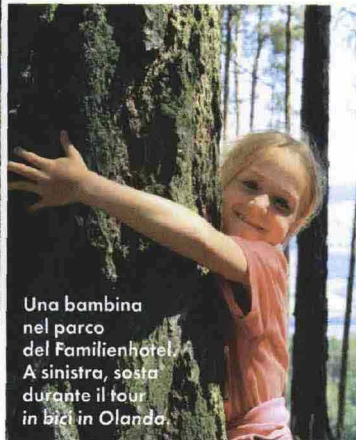
Una bambina nel parco del Familienhotel. A sinistra, sosta durante il tour in bici in Olanda.